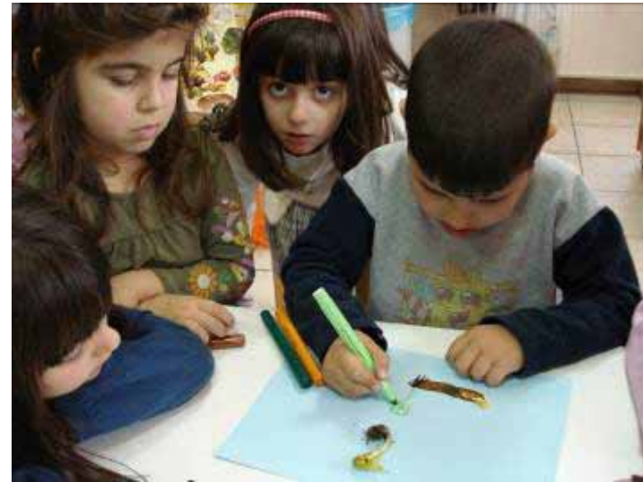
Χρονική εξέλιξη κι αρίθμηση των εικόνων