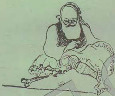
Κερασένος σταυροπόδι έγραβε.

κριές του φουστανέλες καθημερινή και γιορτή, κατακά- θαρες.