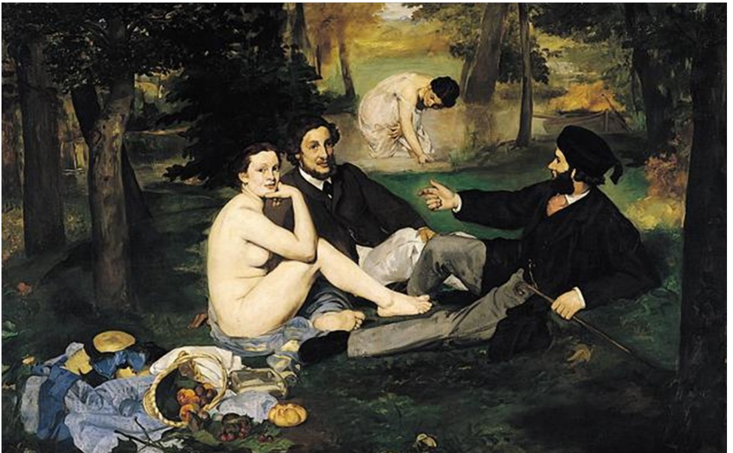
Édouard Manet, Πρόγευμα στη χλόη (Το Λουτρό) [ Déjeuner sur l'herbe_sur_l'herbe 208 x 264.5 εκ, λάδι σε μουσαμά, 1863, Μουσείο Ορσέ, Παρίσι

“δεν υπάρχουν γραμμές στη φύση παρά μόνο περιοχές χρωμάτων, τα οποία αντιμάχονται το ένα το άλλο” Édouard Manet,