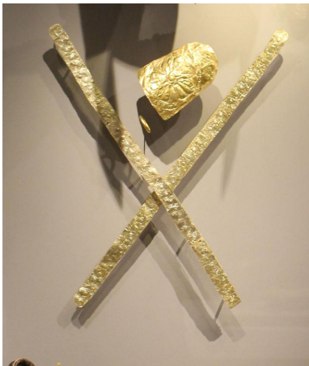
Από τις Ανδρικές Ταφές του Αρχοντικού, περ. 550-540 πΧ