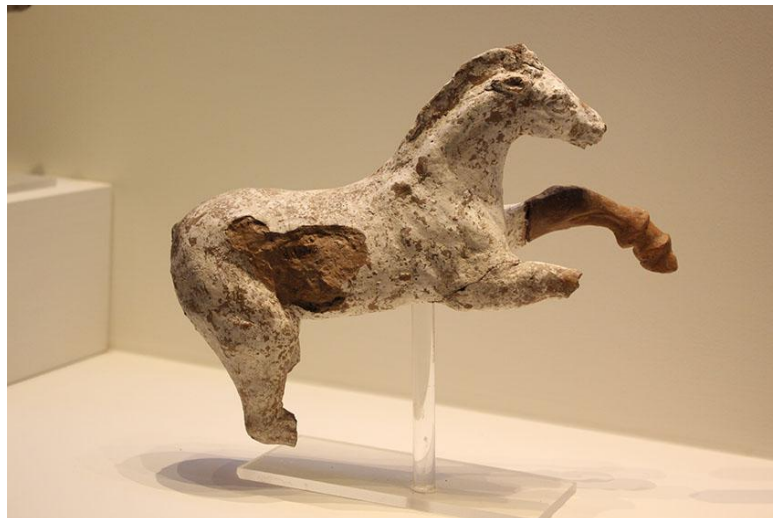
Κεραμικό γλυπτό, (Αναθήματα Θεσμοφόριου τέλος 4 ου αρχές 5 ου αι πΧ)