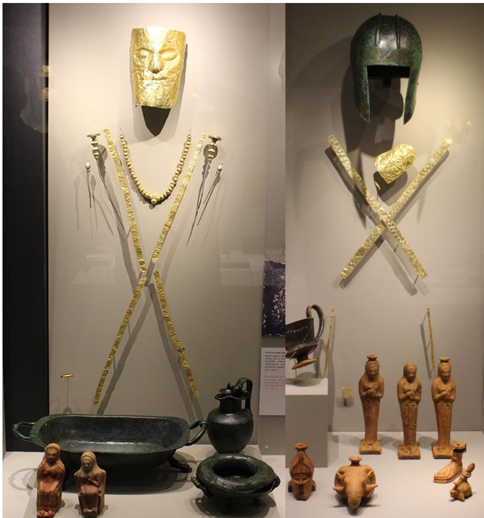
Από τις Γυναικείες και Ανδρικές Ταφές του Αρχοντικού, περ.540- 550 πΧ

Προγραμματίστε τις δραστηριότητες σας ώστε τουλάχιστον μια φορά να βρεθείτε εκεί. Το ένα τριήμερο ανά εξάμηνο είναι υποχρεωτικό. Αναχώρηση για Ψαράδες Παρασκευή μεσημέρι, επιστροφή Κυριακή απόγευμα.