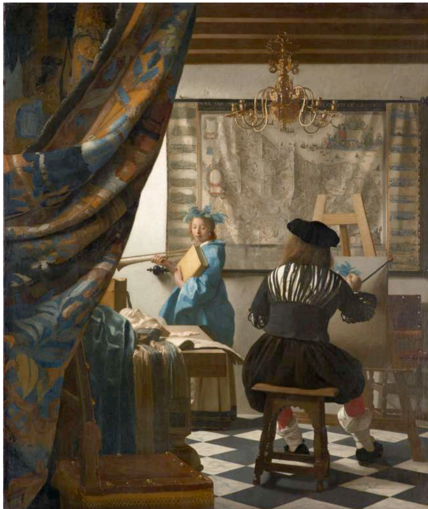
Γιοχάνες Βερμέερ (Johannes Vermeer), Αλληγορία της Ζωγραφικής , 120x100 εκ., λάδι σε μουσαμά, 1666-68

ΠΑΡΑΚΑΛΩ Η ΑΛΛΗΛΟΓΡΑΦΙΑ ΠΟΥ ΑΦΟΡΑ ΤΟ 1 ο ΕΡΓΑΣΤΗΡΙΟ ΝΑ ΑΠΟΣΤΕΛΛΕΤΑΙ ΜΕΣΩ ΤΟΥ e-class