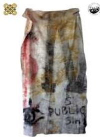
1 ο Εργαστήριο Ζωγραφικής