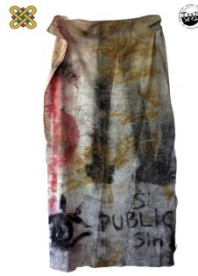
1 ο Εργαστήριο Ζωγραφικής

1 ο Εργαστήριο Ζωγραφικής/ΤΕΕΤ Υπεύθυνοι: Γιάννης Ζιώγας, Ζωγράφος, Καθηγητής Σύνθια Γεροθανασίου, ΕΕΠ