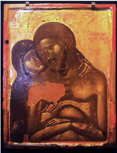
(Αριστερά) Εικόνα Αποκαθήλωσης, 1400 δωρεάς Ειρήνης Ανδρεάδη, Μουσείου Βυζαντινού Πολιτισμού.

Ο Κάμπος ως αρχή το Πεδίο ως μη περατό τέλος