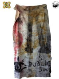
1 ο Εργαστήριο Ζωγραφικής