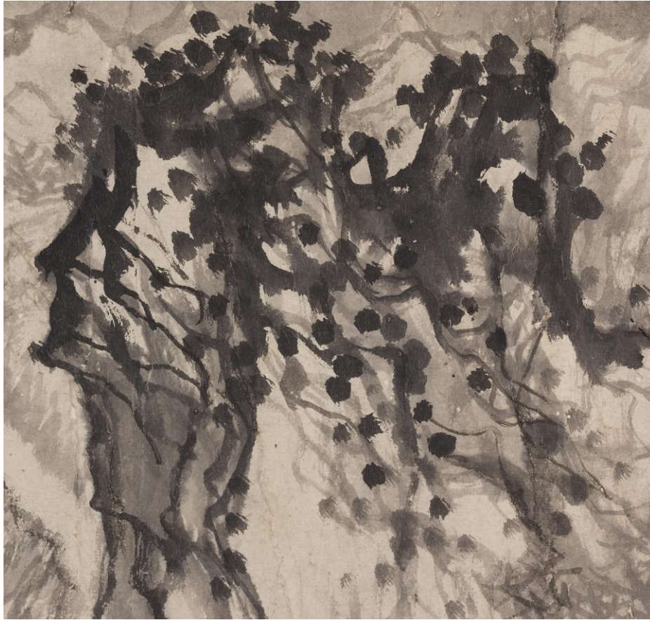
Shi Tao, Τοπίο αποχαιρετισμού για τον κ. Wuweng , , σινική σε μελάνι, 1689