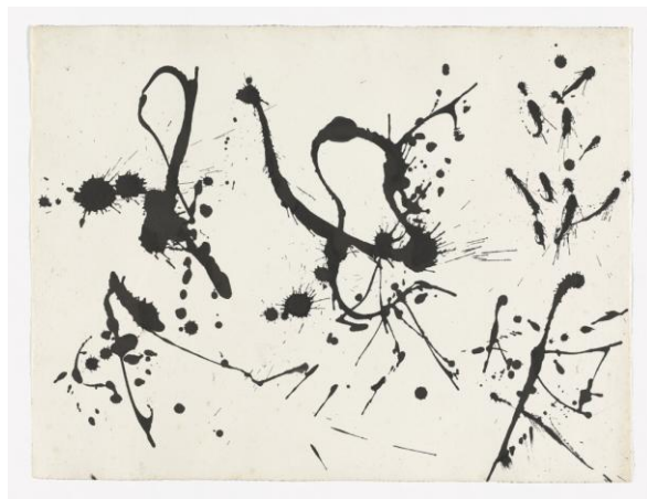
Jackson Pollock untitled μελάνι σε χαρτί 47.9 x 63.1 cm. 1950

9.30-10.15 “μία κηλίδα μελανιού...” ένας στοχασμός με αφορμή τους παρακάτω στίχους του Shi Tao, ζωγράφος/ποιητής 1642-1707