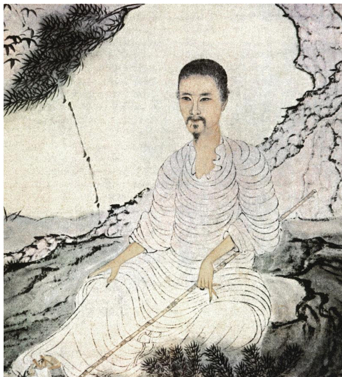
Shi Tao, 10.00 Ο Μάστερ Shi φυτεύοντας πεύκα, σινική σε μελάνι, 1674

9:30 έως 13:00 (Μεσονήσι) Εργασία για την άσκηση σχεδίου/ανθρώπινη φιγούρα με μοντέλο εκ του φυσικού.