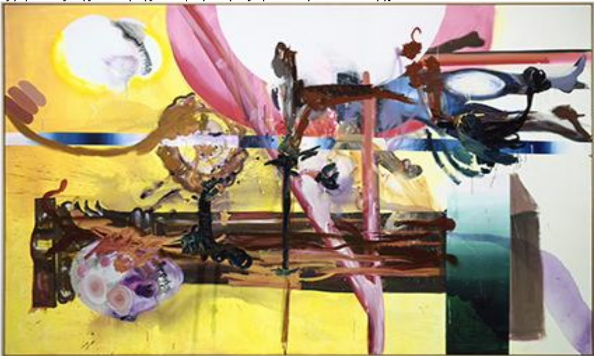
Albert Oehlen, Deathoknocko, 2001, Courtesy Zabłudowicz Collection,

Ο Albert Oehlen (γεν. 1954) είναι ένας ακαδημαϊκός της αφαίρεσης. Χρησιμοποιεί τους κανόνες και την αφαιρετική διάσταση των διδαγμάτων του μοντερνισμού για να κτίσει επιφάνειες μιας σύνθετης πολυπλοκότητας. Σχηματίζει ένα κόσμο που έχει το ναρκισσισμό μιας αποδοχής των τεχνικών του παρελθόντος ως μιας βιρτουόζικης συνθήκης. Η αφαίρεση ως πρωτοπορία δεν υπάρχει πλέον.