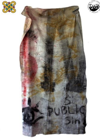
1 ο Εργαστήριο Ζωγραφικής