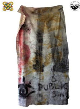
1 ο Εργαστήριο Ζωγραφικής