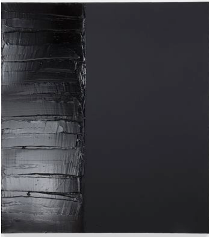
Pierre Soulages 130 x 117 cm ,Acrylic on canvas Lévy Gorvy ,2018