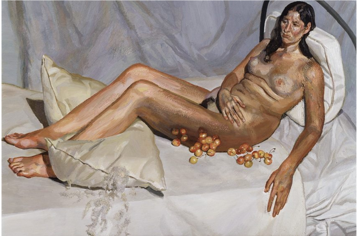
Λούσιαν Φρόντ Lucian Freud – Irish Woman on a Bed, 2003-04. Oil on canvas, 101.6 x 152.7 εκ. Ιδιωτική Συλλογή.