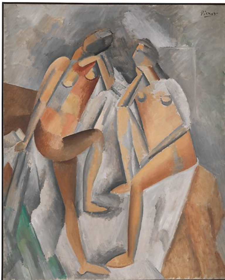
Πάμπλο Πικάσσο bleu Nude. Oil on canvas 1906, 100 x 81 εκ. Ιδιωτική Συλλογή, Παρίσι