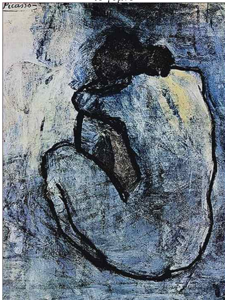
Πάμπλο Πικάσσο bleu Nude. 1902, 40 x 46 εκ. Ιδιωτική Συλλογή, Παρίσι

“Το σώμα είναι η γωνία θέασης του κόσμου. Μπορώ να έχω ένα σημείο θέασης του κόσμου μόνο “αν είμαι στον κόσμο, είμαι του κόσμου” 1 και μπορώ να αντιληφθώ το περιβάλλον μόνο επειδή το κατοικώ”