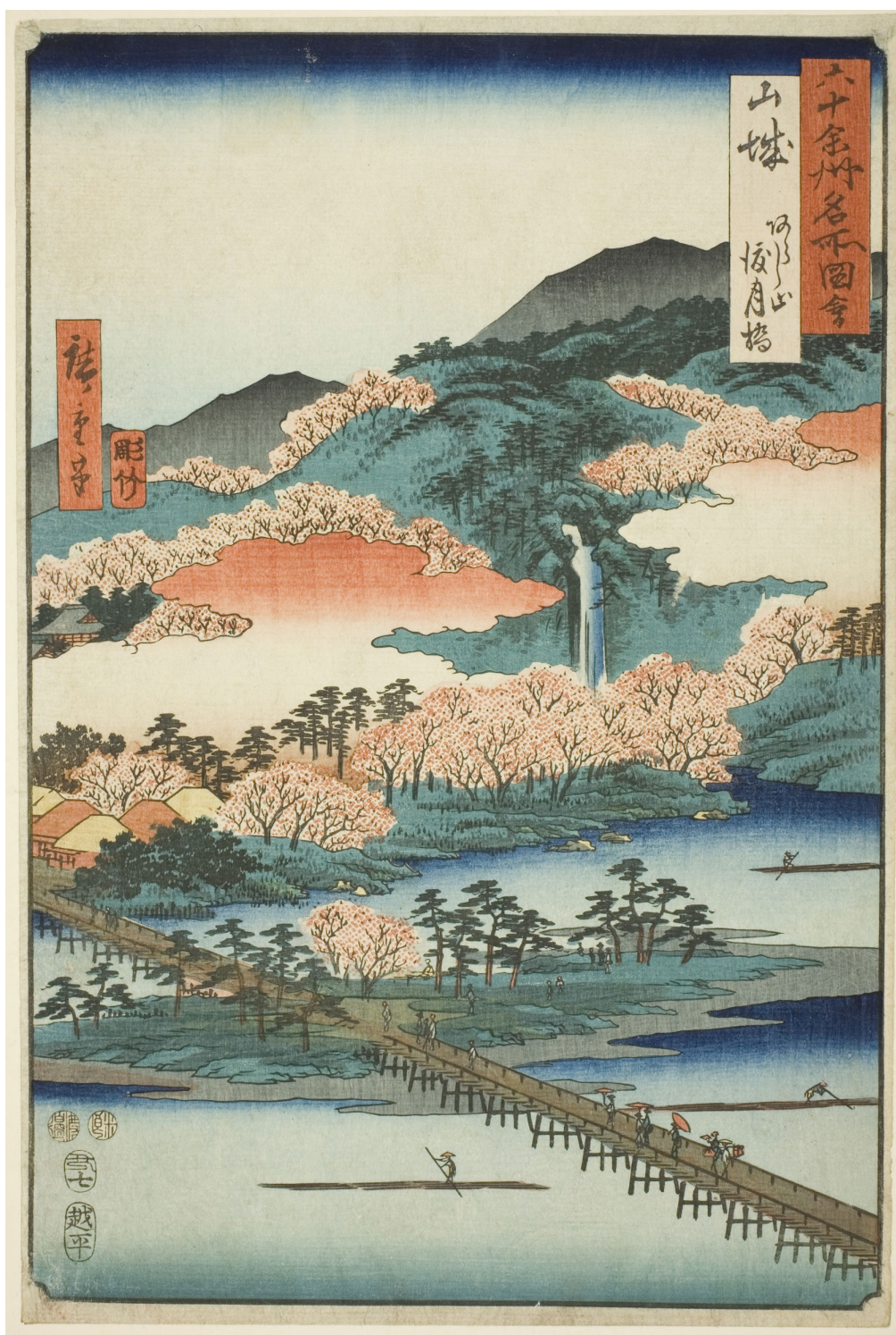
Utagawa Hiroshige, "Yamashiro Province: The Togetsu Bridge in Mount Arashi" Ξυλογραφία, 1853