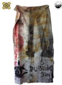
1 ο Εργαστήριο Ζωγραφικής