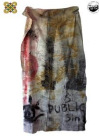
1 ο Εργαστήριο Ζωγραφικής