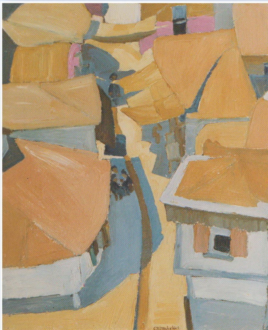
εξ, 1925 σε χαρτόνι, 33,5 x 26 εκ.

Παρακαλώ προγραμματίστε τις υποχρεώσεις σας ώστε να είστε εκεί τουλάχιστον μία φορά. Στην ημερομηνία του Μαΐου θα διεξάγεται παράλληλα το Διαπανεπιστημιακό Μεταπτυχιακό Πρόγραμμα Σπουδών «Κλινική Κοινωνιολογία και Τέχνη» Του ΤΕΕΤ και του Τμήματος Κοινωνιολογίας του Πανεπιστημίου Αιγαίου.