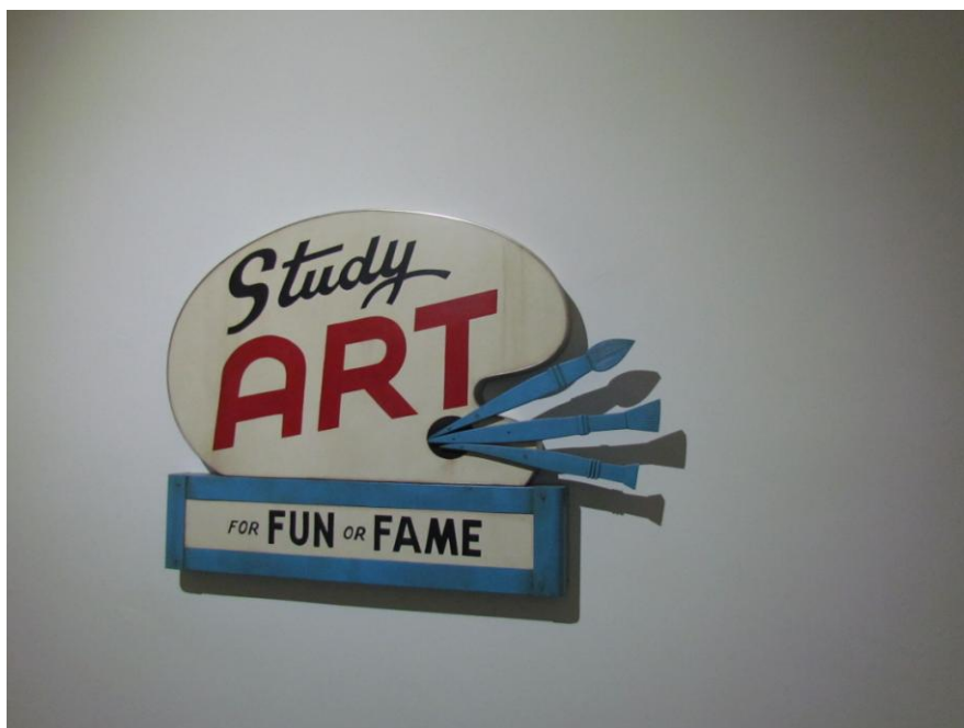
John Waters, 2007, Arsenale, Βενετία, 2017

9:30 έως 13:00 (Μεσονήσι) Εργασία για την άσκηση σχεδίου/ανθρώπινη φιγούρα με μοντέλο εκ του φυσικού.