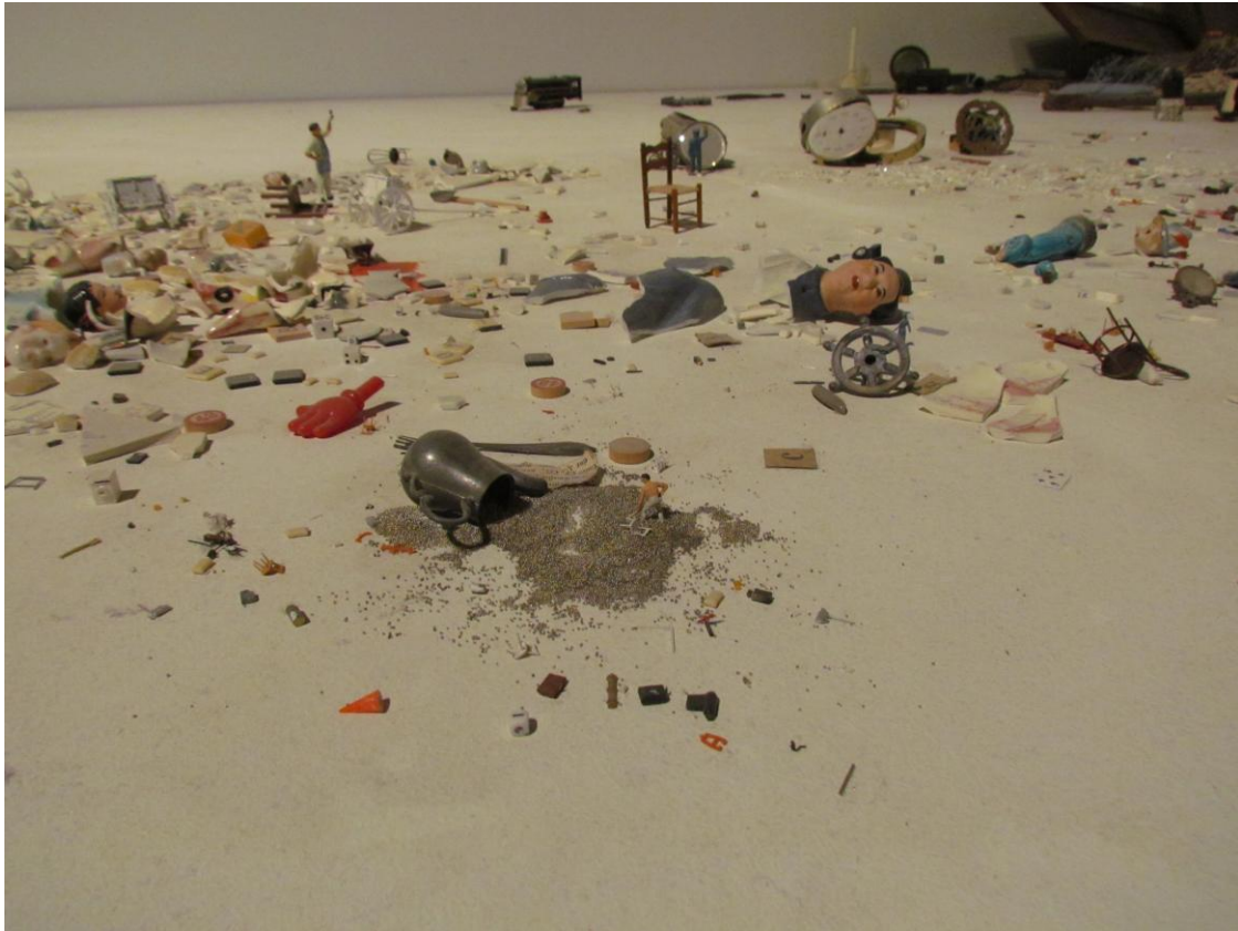
Liliana Porter, 57 th Bienalle Venice, 2017