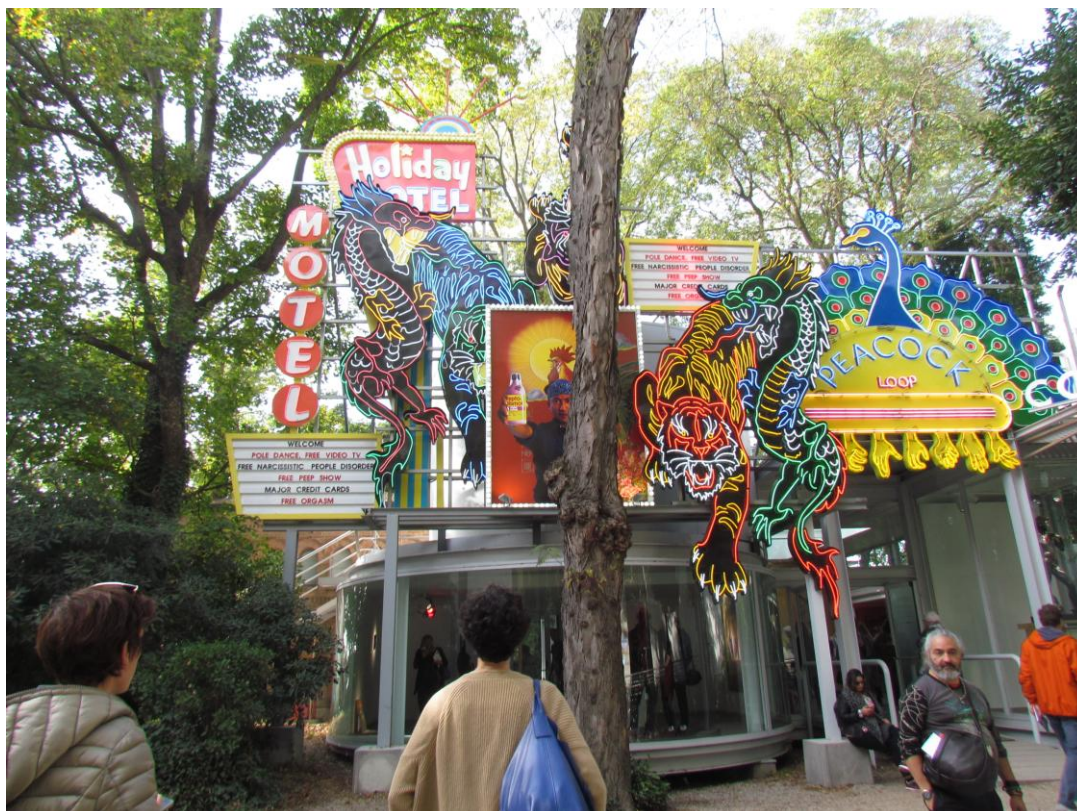
Περίπτερο Ν. Κορέας, 57 th Bienalle, Βενετία, 2017