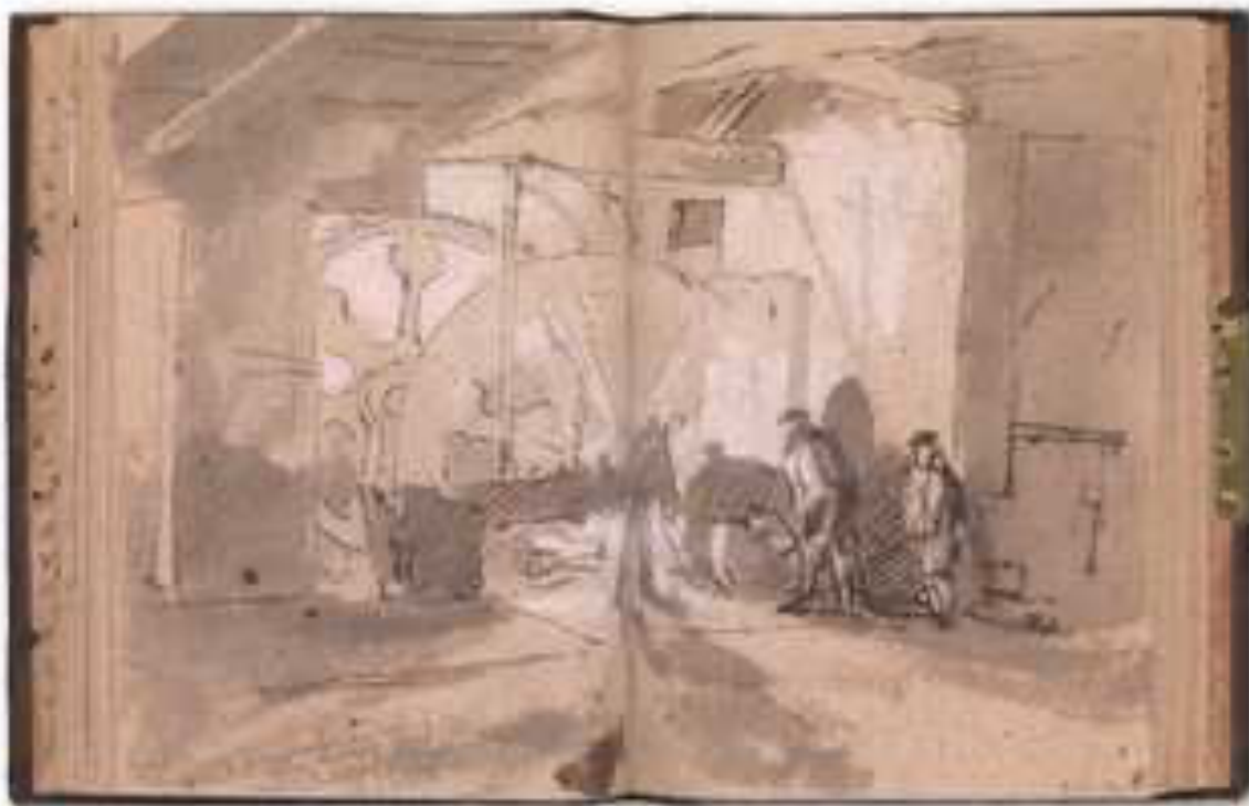
William Turner, Το εσωτερικό ενός σιδηρουργείου , 17,5 x 25 εκ., γραφίτης, μελάνι και πένα, τέμπερα και ακουαρέλα, 1796-7

Τεχνικές ακουαρέλας. Φροντίστε να έχετε ανάλογα χρώματα, κατάλληλα χαρτιά και στρογγυλά πινέλα.