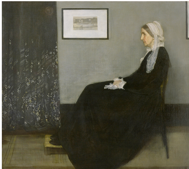
Ουίςλερ, Διευθέτηση σε γκρίζο V, 144x162 εκ., λάδι σε μουσαμά, 1871