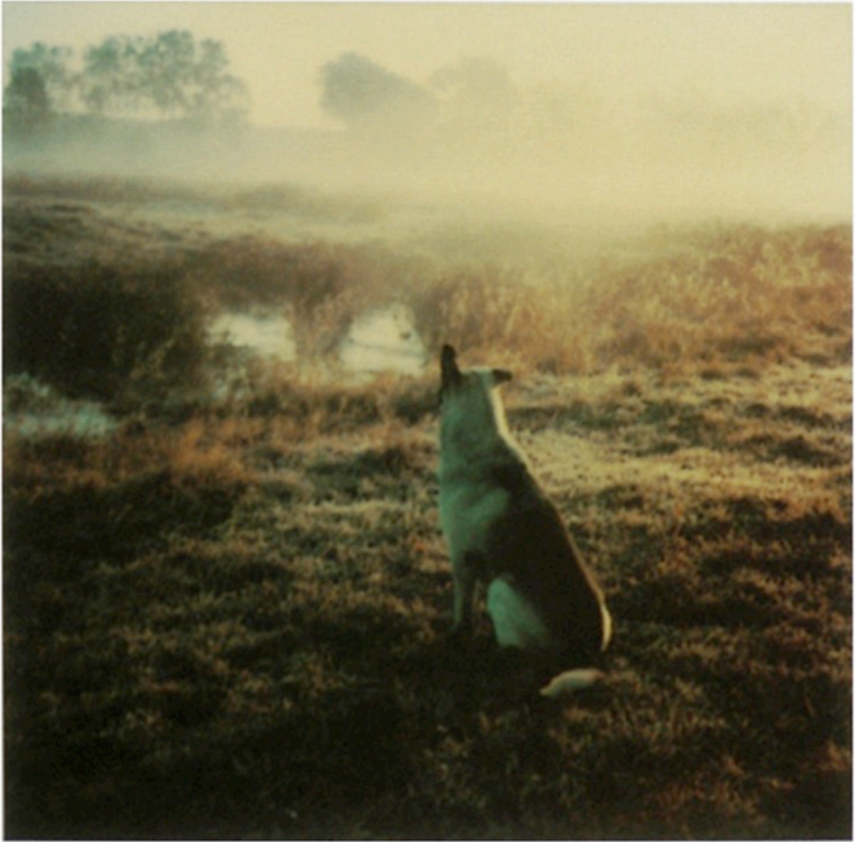
Polaroid by Andrei Tarkovsky, 1979-84.

https://www.archisearch.gr/photography/the-mysterious-world-of-andrei-tarkovsky-s-polaroids/