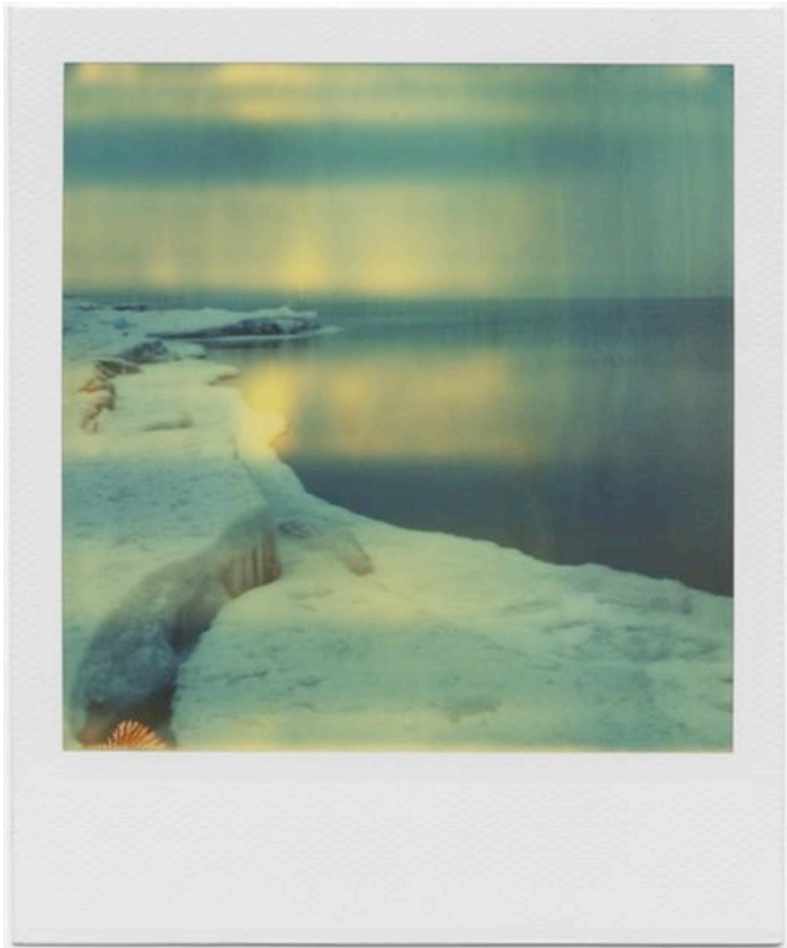
Polaroid by Andrei Tarkovsky, 1979-84.