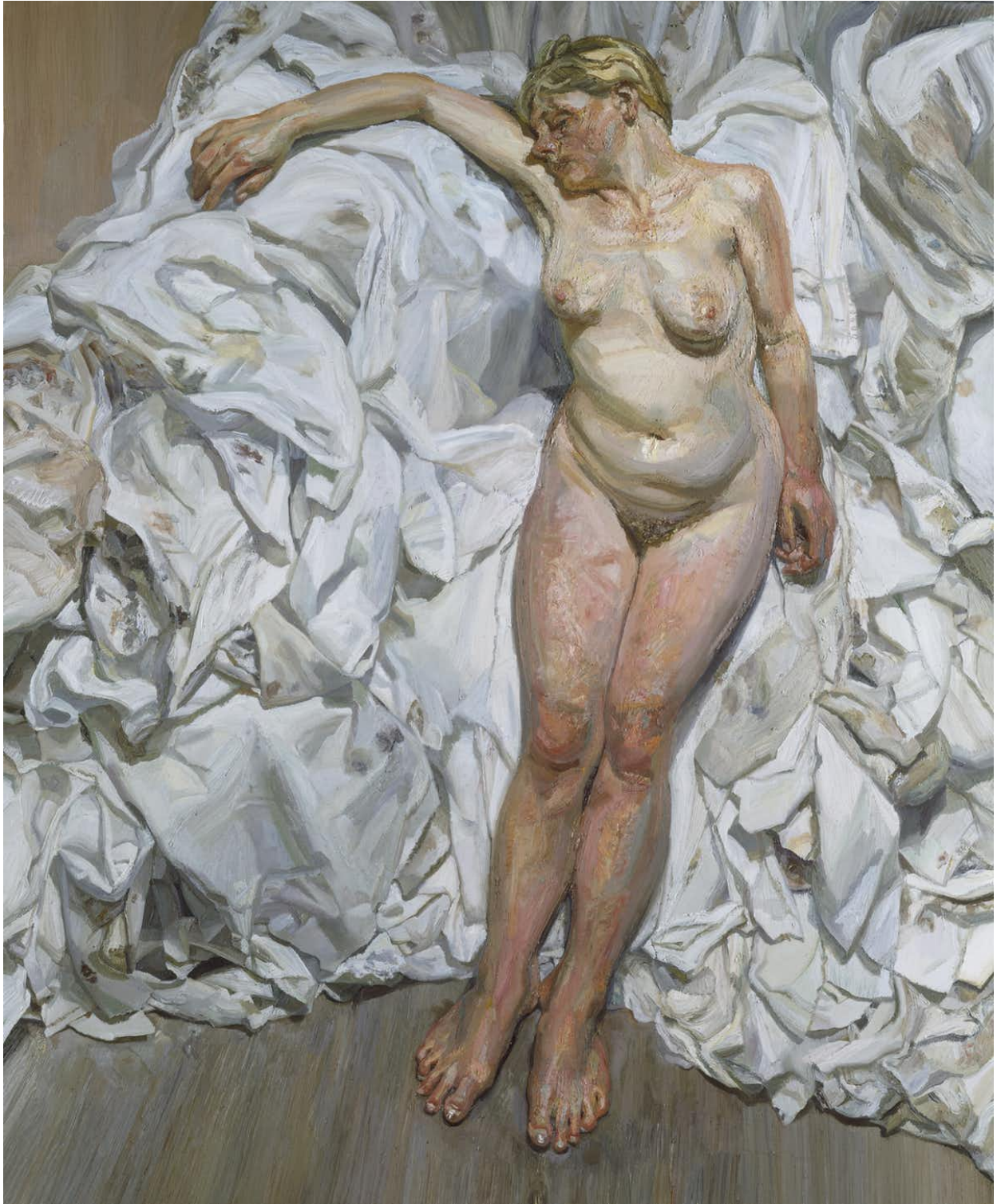
Lucian Michael Freud, Standing by the rags , 1988–89. oil on canvas, 168.9 x 138.4 cm (Tate Britain, London)