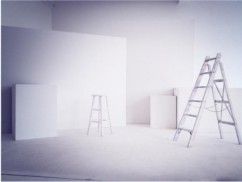
Ο λευκός χώρος ως πεδίο έκθεσης και ανάπτυξης μιας ιδέας.