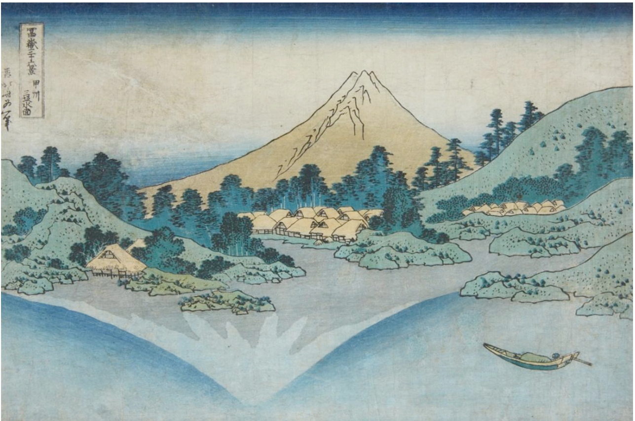
Κατσουσικά Χοκουσάι, Mt. Fuji reflected in the lake near Misaka , ξυλογραφία.