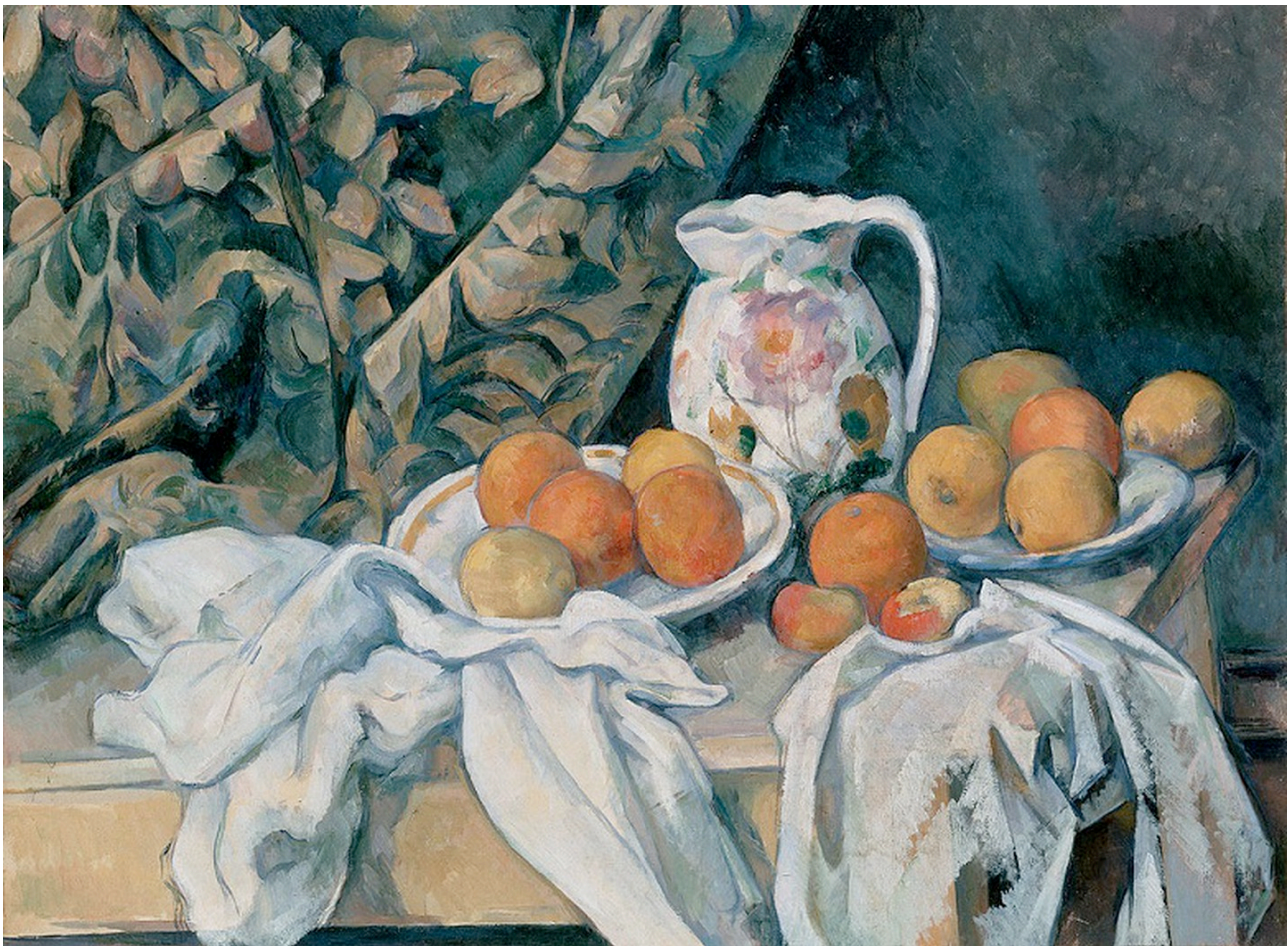
Πολ Σεζάν, Still Life with Curtain and Flowered Pitcher (1895) 55x74 εκ. Λάδια σε καμβά, Ερμιτάς, Αγ. Πετρούπολη, Ρωσία