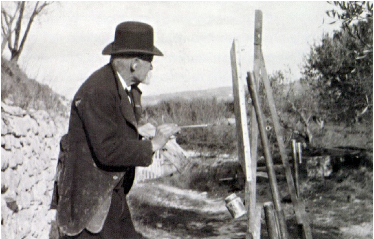
Σεζάν ζωγραφίζει στη Λε Λωβ (Les Lauve), 1906. Φωτ. Εμίλ Μπερνάρντ

«...Όταν ο Σεζάν αναζητά το βάθος, στην πραγματικότητα αναζητά αυτήν ακριβώς την έκρηξη του Είναι• αυτή την έκρηξη η οποία βρίσκεται μέσα σε όλους τους τρόπους του χώρου, όπως επίσης και μέσα στη μορφή..» 1