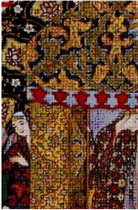
Σκηνή στρατοπέδου από την ύστερη κλασική περίοδο της Περσικής τέχνης. Ο Μάιρυν κατασκοπεύει την αγαπημένη του. Η μινιατούρα και λεπτομέρειά της.