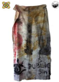
1 ο Εργαστήριο Ζωγραφικής