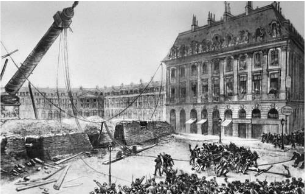
Το γκρέμισμα της πλατείας Βαντόμ, Παρίσι 1870

Ο Καλλιτέχνης αναζητεί την ταυτότητά του, συγκρούεται με αυτό που είναι με αυτό που θέλει η κοινωνία να τον καταστήσει, με εκείνο που η πραγματικότητα απαιτεί από αυτόν: από το είναι της δημιουργικής του κατάστασης. Ο Κουρμπέ γκρεμίζει τη στήλη της Πλατείας Βαντόμ για να σχηματίσει κόσμους αλλότριους κόσμους ουτοπικούς. Ο Ρουμπλιώφ και ο Ταρκόφσκι πασχίζουν μέσα από την πάλη της εσωτερικής αντίφασης