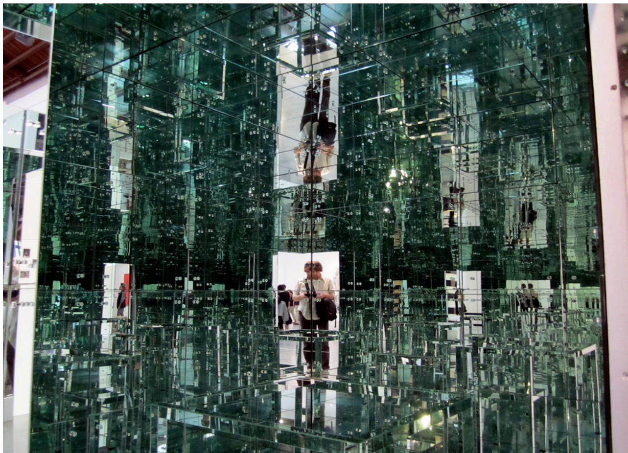
Lucas Samaras' "MIRRORED ROOM" 1966