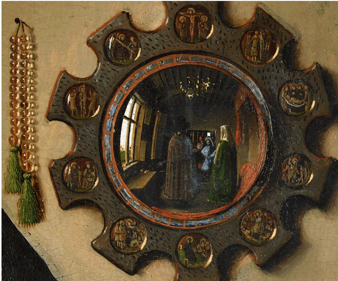
Γιαν Βαν Άικ, Ο γάμος των Αρνολφίνι λεπτομέρεια, 1434, λάδι σε τρεις δρύινες σανίδες 81,8x59,7εκ. Εθνική Πινακοθήκη Λονδίνου

Ο κυρτός καθρέφτης του Γιαν Βαν Άικ. Η σύγχρονη έρευνα τον αναγνώρισε ως “Μάτι του Θεού”. Το μάτι το θεϊκό, σε συμμετρία με τον ζωγράφο, γίνεται ισοδύναμό του. Ο ζωγράφος δεν είναι πλέον μόνο αυτόπτης μάρτυς. Γίνεται παντεπόπτης.