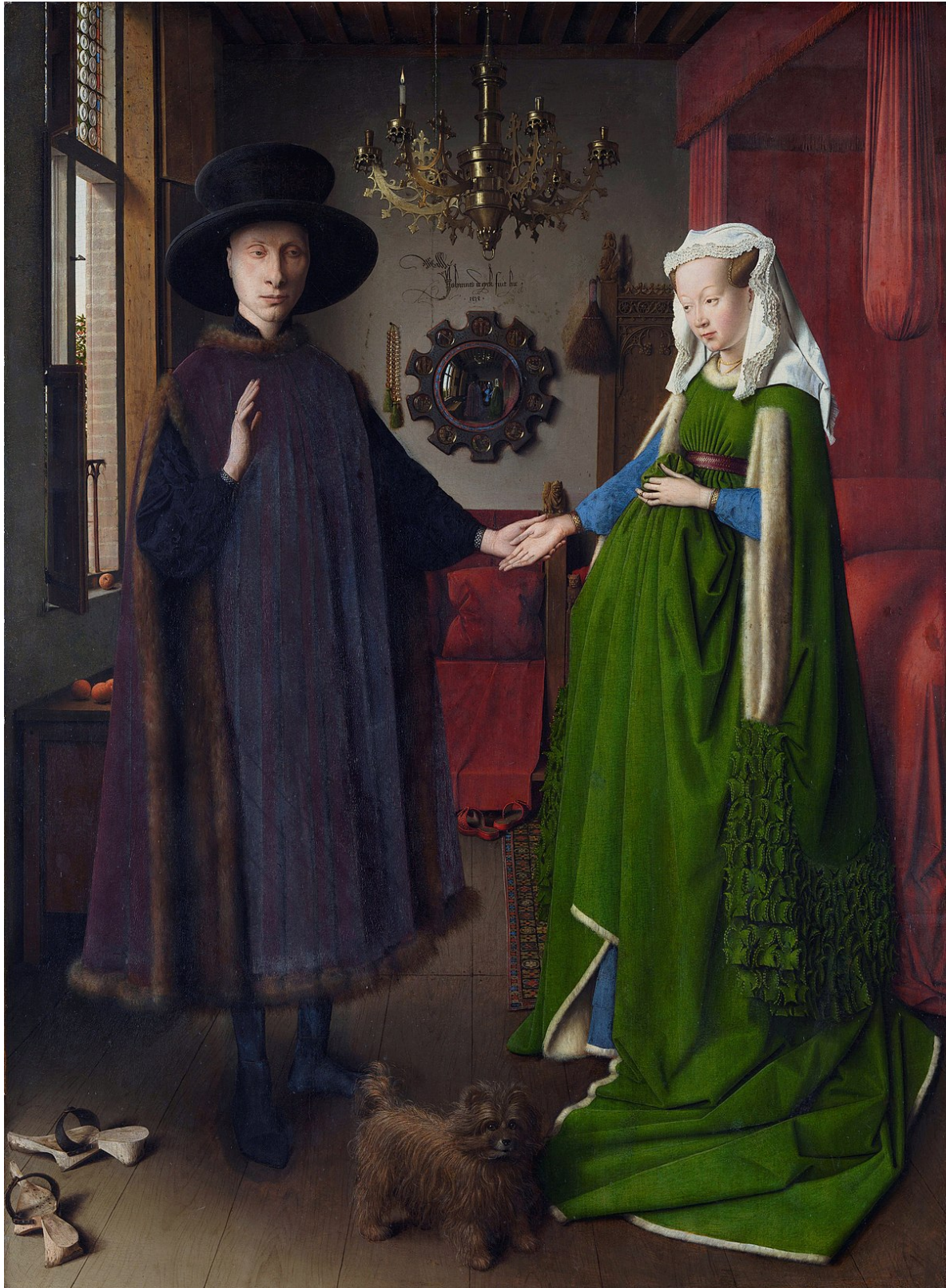
Γιαν Βαν Αικ, Ο γάμος των Αρνολφίνι 1434, λάδι σε τρεις δρύινες σανίδες 81,8x59,7εκ. Εθνική Πινακοθήκη Λονδίνου