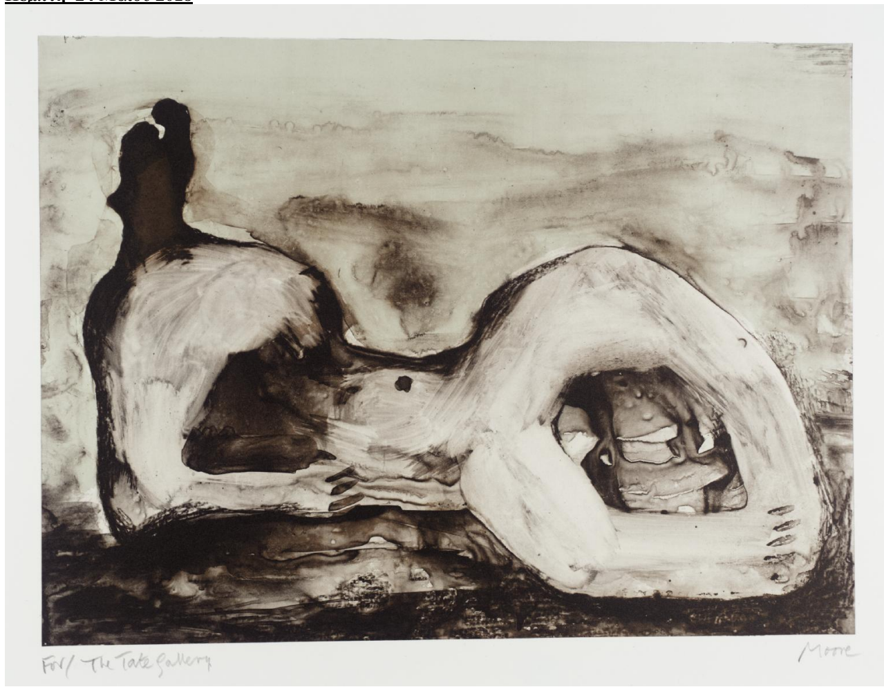
Henry Moore Reclining Figure: Bone 1982 302x410χιλ.. Λιθογραφία σε Χαρτί Συλλογή Tate Presented by the Henry Moore Foundation 1982