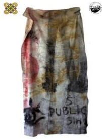
1 ο Εργαστήριο Ζωγραφικής