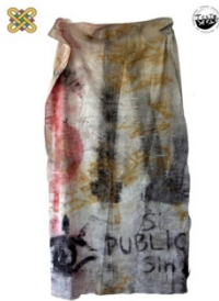
1 ο Εργαστήριο Ζωγραφικής