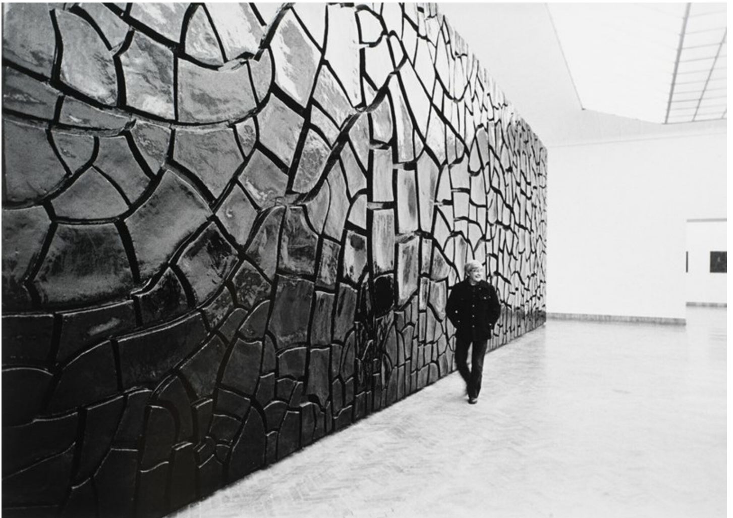
Alberto Bouri Grande Cretto Nero , 1976