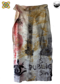
1 ο Εργαστήριο Ζωγραφικής