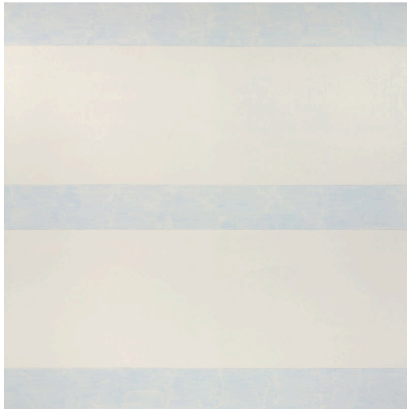
Agnes Martin, Untitled (Perfect Day) , 1993-1994, acrylic on linen, 60 1/16 in. x 60 1/16 in.,