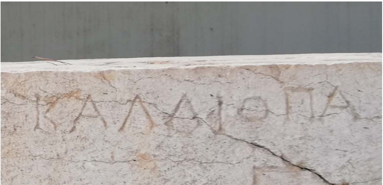
Η κρυμμένη Μούσα (Η Καλλιόπη έχει φύγει)

Χαιρετώ τους εν δυνάμει πτυχιούχους μας.