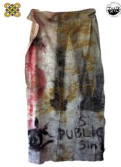
1 ο Εργαστήριο Ζωγραφικής