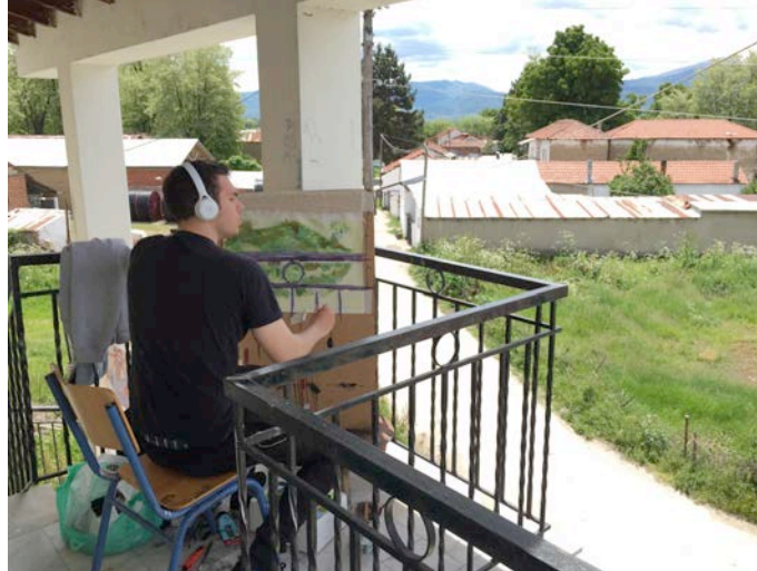
Στιγμιότυπα, από το φωτογραφικό αρχείο του 1ου εργαστηρίου, Μεσσήσι.