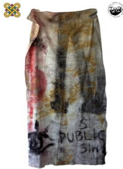
1 ο Εργαστήριο Ζωγραφικής