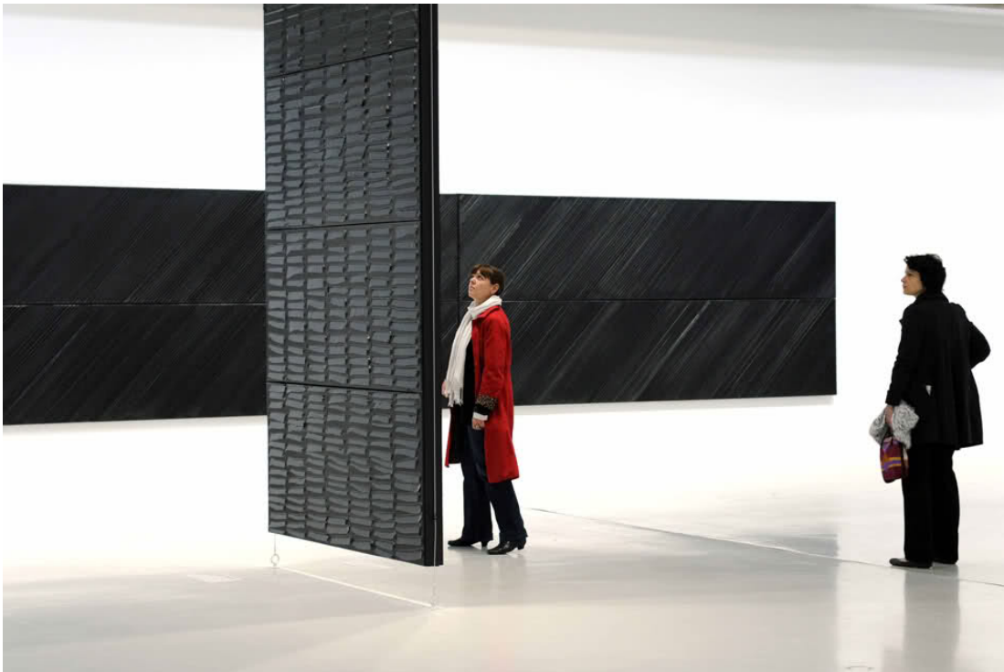
Έκθεση Pierre Soulages, Κέντρο Πομπιντού, Παρίσι, 2009

Τι είναι το α-λογο? Τι είναι το μέρος τι είναι μέρος μιας πραγματικότητας και τι μια προσέγγιση πέραν των ορίων. Η εικόνα δεν έχει όρια, διότι τελικά τα όρια είναι εσωτερικά και είναι τα όρια του θεατή. Οι προσεγγίσεις είναι πολλές και σε πολλά σημεία κάτι που είναι α-στοχο δημιουργεί στόχο.