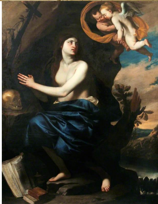
Πάνω: Guido Cagnacci, Μετανοούσα Μαγδαληνή , 229.2 cm × 266.1 cm, λάδι σε μουσαμά, 1660-62