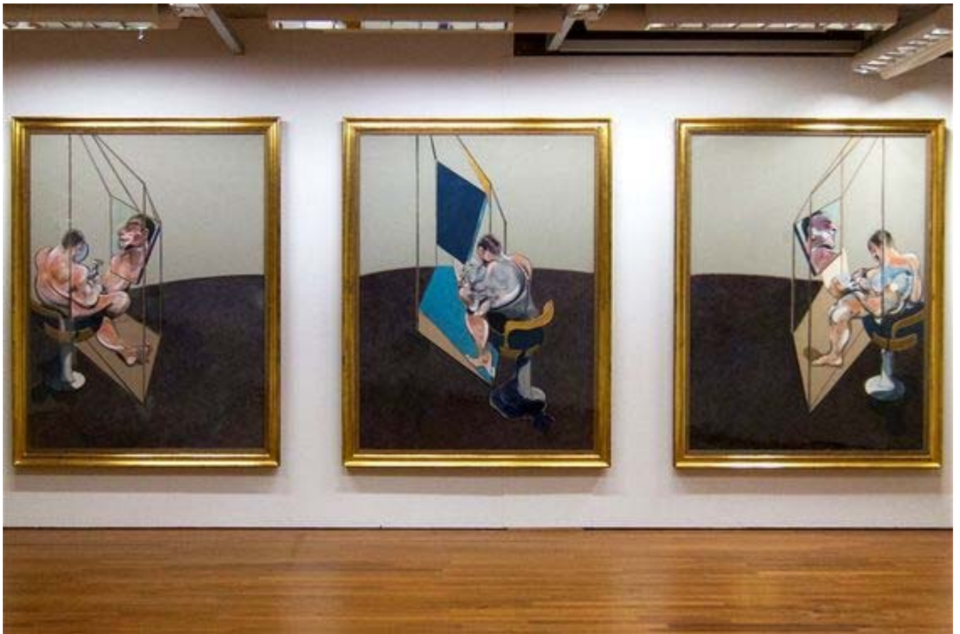
Francis Bacon, Τρίπτυχο , Three Studies of the Male Back , 3X 198X147,5cm, λάδι σε μουσαμά, 1970