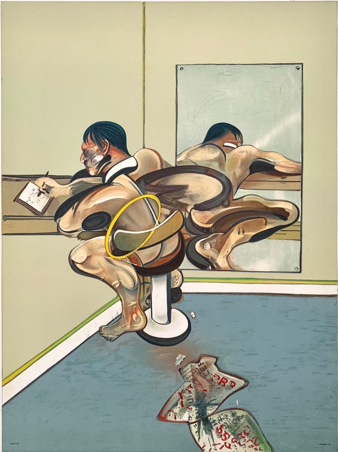
Francis Bacon, Writing Reflected in a Mirror , 198X147,5cm, λάδι σε μουσαμά, 1977