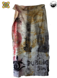
1 ο Εργαστήριο Ζωγραφικής