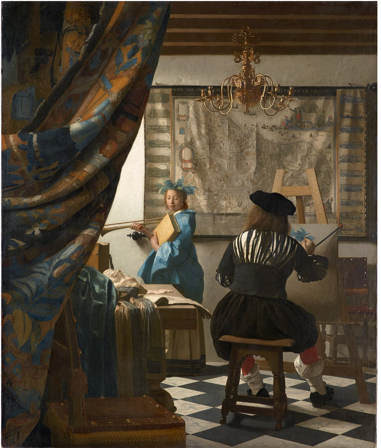
Jan Vermeer The Art of Painting , λάδια σε καμβά, 120x100εκ. 1666-68 Μουσείο Ιστορίας της Τέχνης, Βιέννη