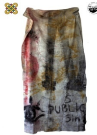
1 ο Εργαστήριο Ζωγραφικής