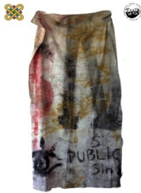
1 ο Εργαστήριο Ζωγραφικής