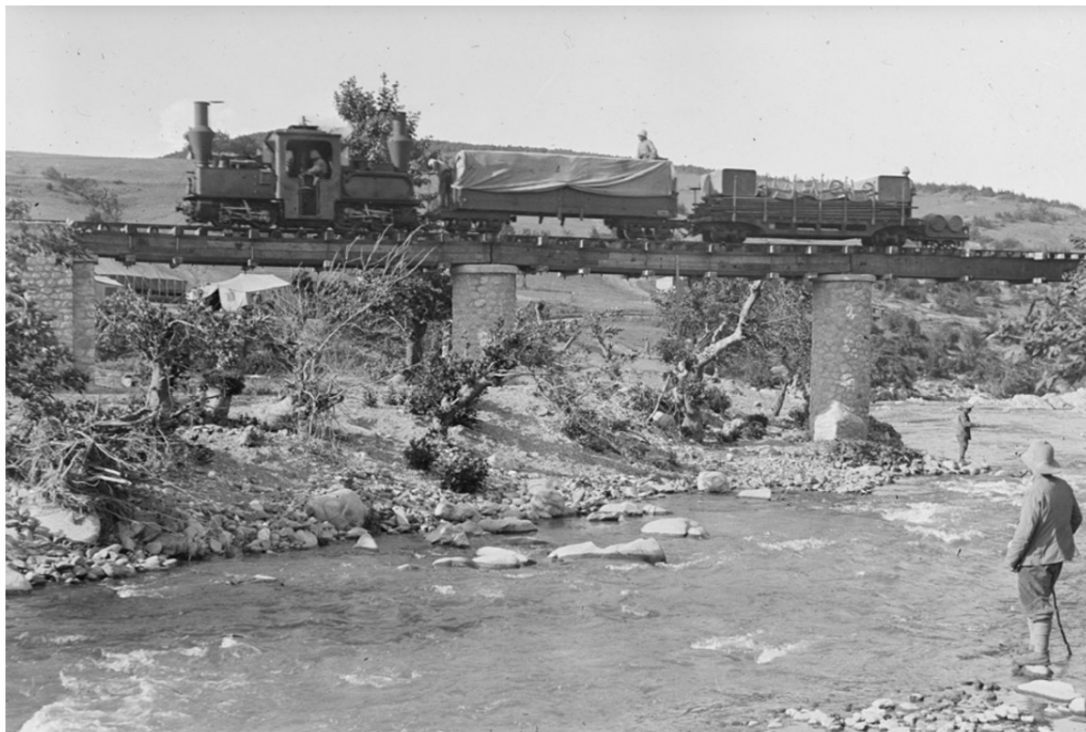
Τραινάκι Decauville στο Kodza-Derre παρόμοιο με εκείνο της Φλώρινας (1917).

Αναζητώντας τα καλντερίμια του Πρώτου Παγκοσμίου Πολέμου και το θρυλικό τραινάκι Decauville. Ραντεβού κατόπιν συνεννόησης θα να συμμετάσχουμε σε μια συλλογική διαδικασία καθαρισμού του καλντεριμιού της Μεγάλης Ανατολικής Στρατιάς στα Άλωνα.