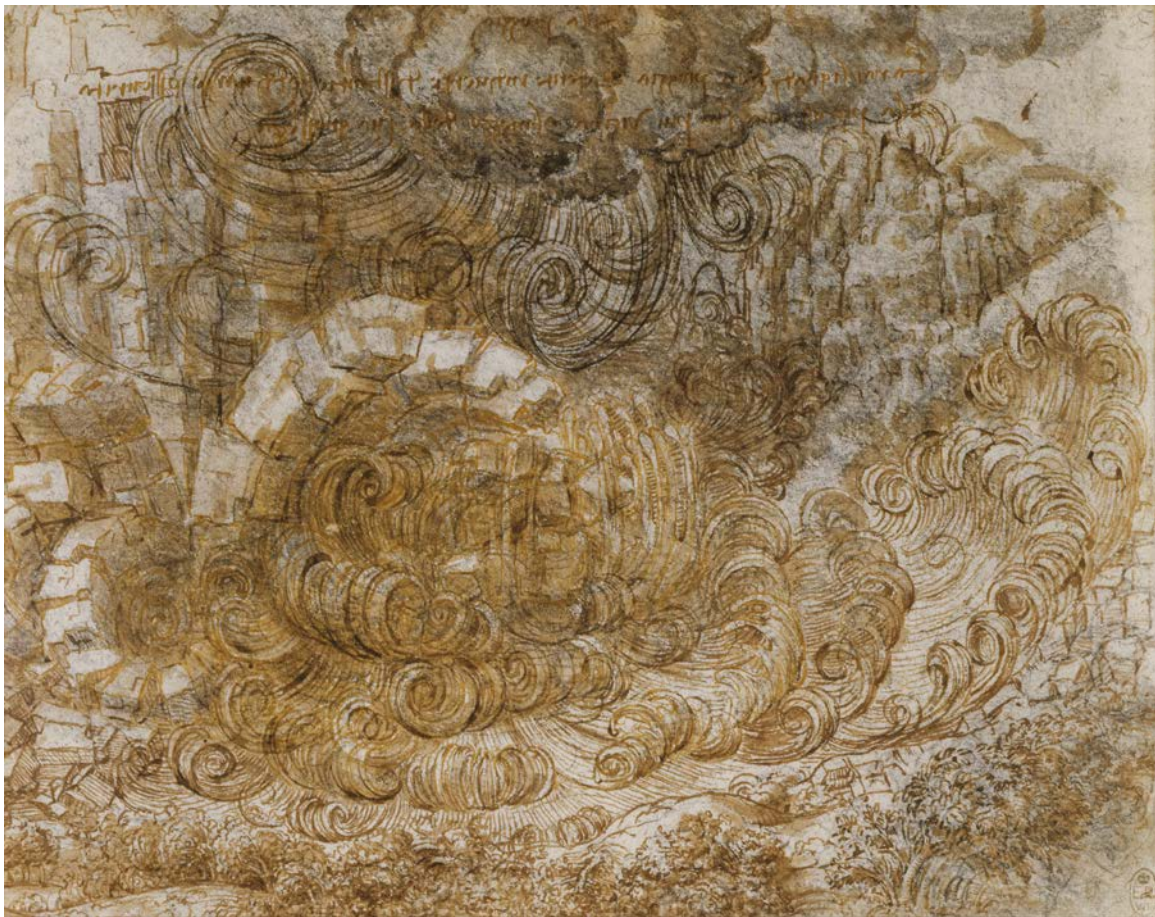
X Λεονάρντο ντα Βίντσι, Ένας Κατακλυσμός , πενάκι και κιμωλία σε χαρτί. 16x20 cm, 1517-18

Οι Κατακλυσμοί ( Deluges ) του Ντα Βίντσι είναι μια σειρά σχεδίων που πραγματοποίησε ο Ντα Βίντσι προς το τέλος της ζωής του (1517-18) και απεικονίζουν μια φυσική καταστροφή, που πιθανόν έζησε ο Ντα Βίντσι και συνέβη στη Βόρειο Ιταλία. Τα σχέδια μικρά σε μέγεθος (κατά μέσο όρο 16x 21 εκ. το καθένα) συμπυκνώνουν πλήθος γραφών, ενεργειακών κινήσεων και εναλλαγών.