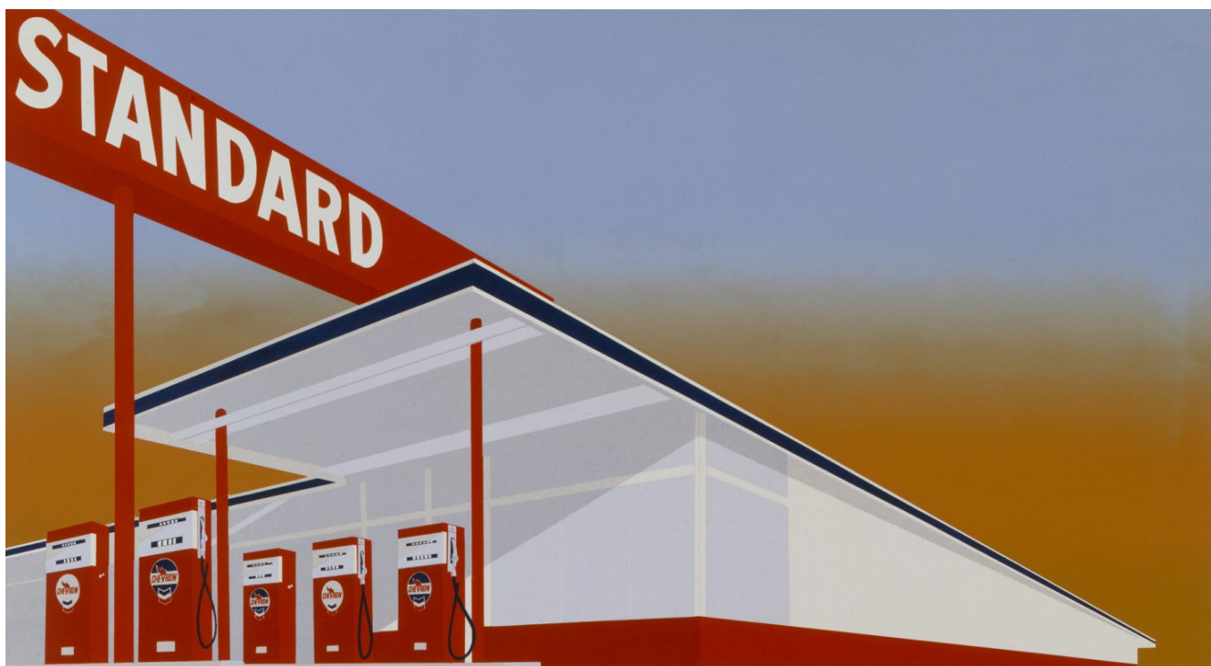
Ed Ruscha, Standard Station , Screenprint. 160 x 101 cm 1966