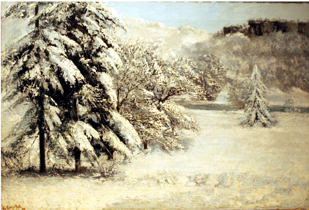
Gustave Courbet, Winter landscape, λάδι σε μουσαμά, 40x31εκ., Museum Nacional de Arte Antiga, Λισαβόνα, 1865

ο χώρος προκύπτει ως μια εναλλαγή και εναπόθεση αυτονομημένων μονοχρωματικών επιπέδων