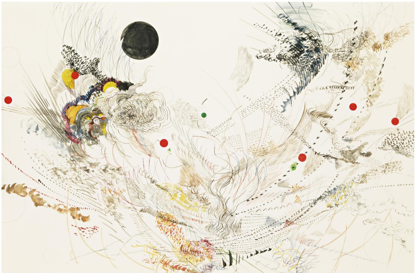
Julie Mehretu UNTITLED (VAN GELDER 3; JM D-1.05) ink, gouache and watercolor on paper. 63.5 by 95.9 cm. 2005

Συζήτηση πάνω στο είναι και το φαίνεσθαι στην τέχνη με αφορμή το έργο του Σεζάν.