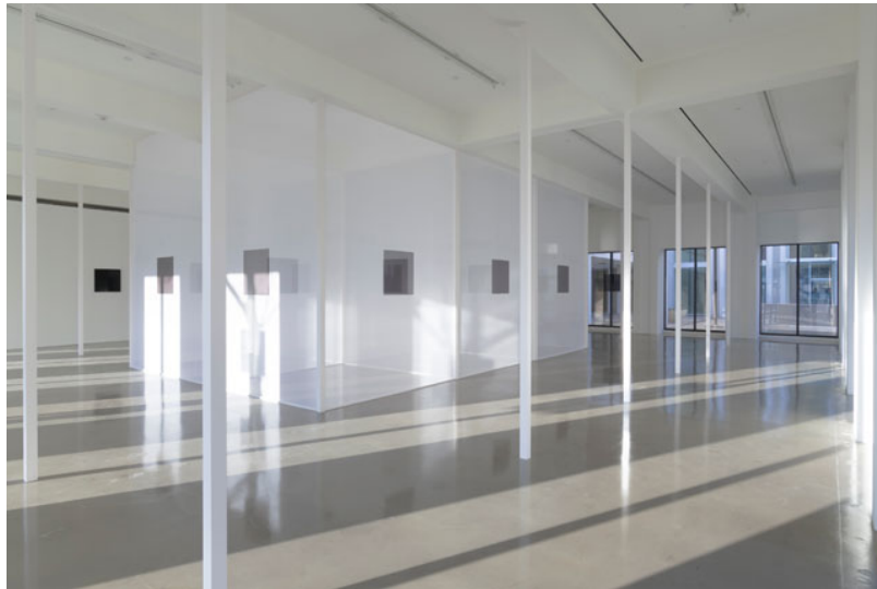
Robert Irwin, Installation View, 2018