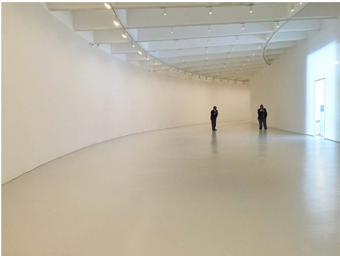
Robert Irwin's "Squaring the Circle," commissioned for the Hirshhorn Museum

Robert Irwin (γ. 1932), ο ζωγράφος του ελάχιστου