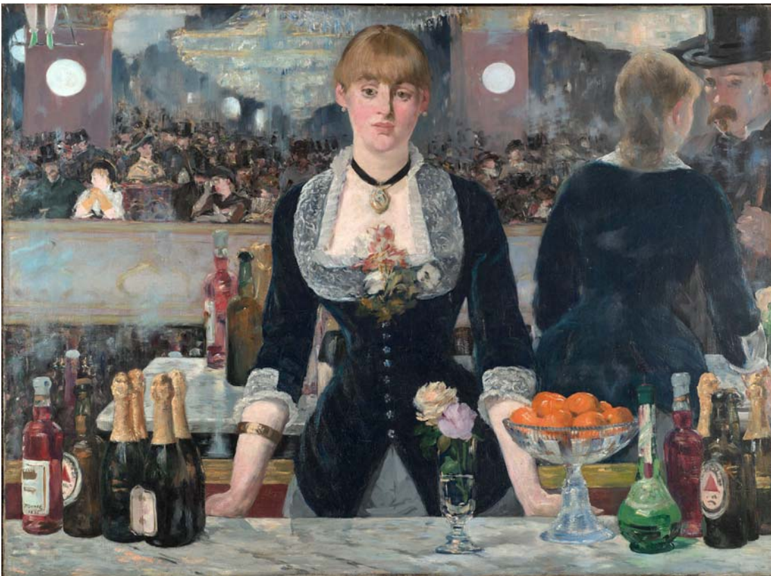
Edward Manet, A Bar at the Folies-Bergère , λάδι σε μουσαμά, 96x130 εκ., 1882

Το επίπεδο του καθρέφτη δημιουργεί παράλληλες πραγματικότητες, τουλάχιστον αυτή είναι μια από τις ιδιότητές του. Ο καθρέφτης είναι το επίπεδο όπου ο χώρος μπορεί να μετατρέπεται σε γίνεται μια οθόνη προβολής φαντασιώσεων. Ο καθρέφτης δημιουργεί (παρά την ομοιότητα) έναν Άλλο. Η Αντιστροφή ως μήτρα γεννά τη νέα Άλλη πραγματικότητα Το είδωλο του καθρέφτη δεν είναι ΙΔΙΟ είναι ΟΜΟΙΟ. Δεν είναι ΤΟ ΑΥΤΟ είναι το ΟΜΟΙΩΜΑ που δυναμικά αυτονομείται .