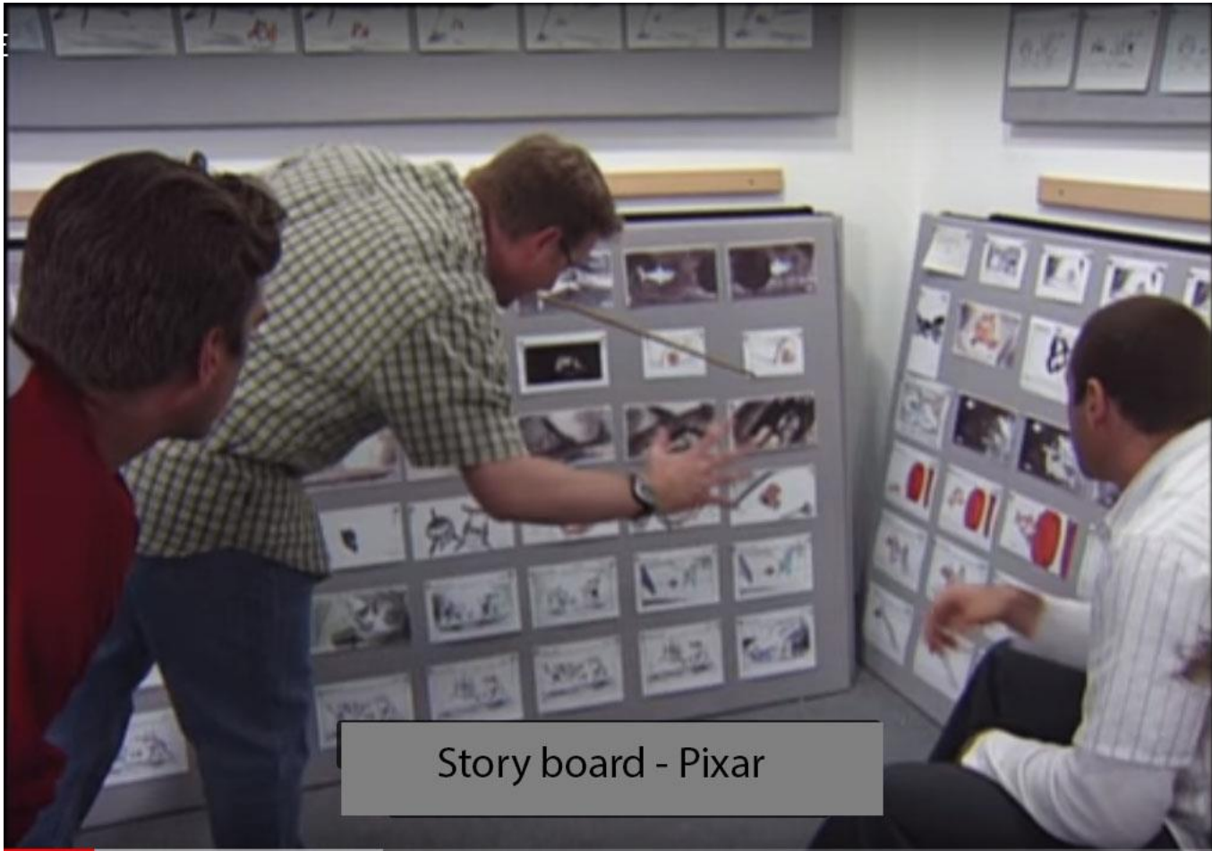
Story board - Pixar